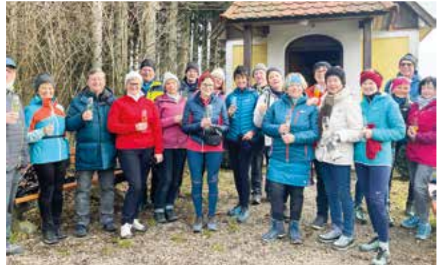
Ein Prosit auf das neue Jahr bei der Franziskuskapelle