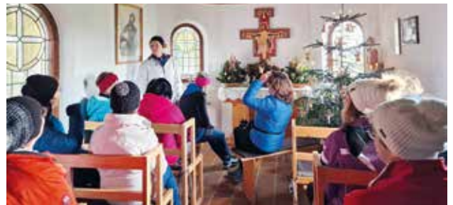
Andacht in der Franziskuskapelle