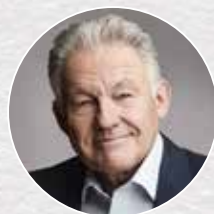
Landesobmann LH a. D. Dr. Josef Pühringer