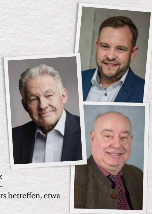
LH A.D. DR. JOSEF PÜHRINGER LANDESOBMANN

In dieser Broschüre zeigen wir die Risiken für ältere Menschen in diesen Bereichen auf und geben Tipps zur Prävention. Schließlich können sowohl kriminelle Handlungen gegen Seniorinnen und Senioren, als auch Unfälle und Stürze oft durch das richtige Verhalten und gewisse Vorsorgemaßnahmen verhindert werden.