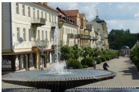
Radfahrtage Marienbad: 21. bis 25. Mai 2024