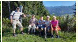
... und viele, viele Wanderungen und Radfahrten