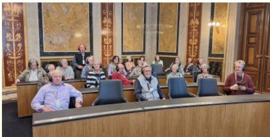
Parlament, Schlumberger Sektkellerei, 04. April 2024