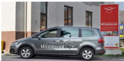
Krankentransporte - Flughafentaxi

Mit Freunden oder Kollegen einen Ausflug oder eine Reise zu unternehmen macht doppelt so viel Spaß. Gerne planen und organisieren wir Ihr Vorhaben. Ganz individuell und auf Ihre Wünsche abgestimmt. Egal mit welchem Verkehrsmittel Sie reisen möchten, wir stehen Ihnen gerne kompetent zur Seite mit unseren Ideen und Kontakten zu Fluglinien, Hotels und Reiseleitern.