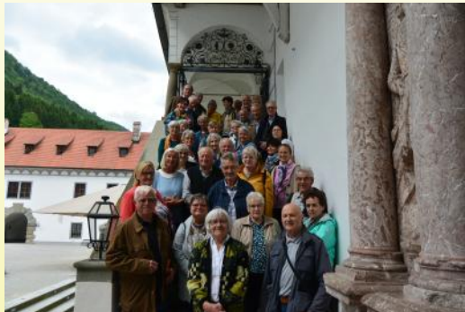
Wallfahrt Mariazell, Gaming, 16. Mai 2024