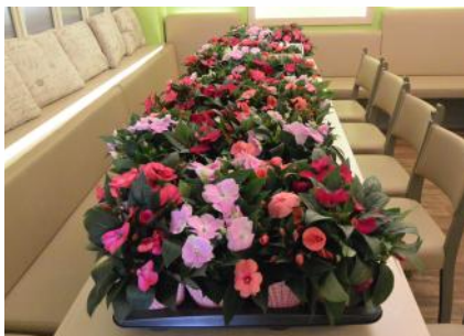
Muttertagfeier, 11. Mai 2024