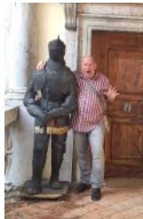
Eisenerz - Burg Strechau, 22. August 2024