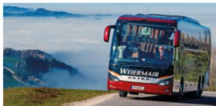
Ihre private Gruppenreise - perfekt organisiert

Mit Freunden oder Kollegen einen Ausflug oder eine Reise zu unternehmen macht doppelt so viel Spaß. Gerne planen und organisieren wir Ihr Vorhaben. Ganz individuell und auf Ihre Wünsche abgestimmt. Egal mit welchem Verkehrsmittel Sie reisen möchten, wir stehen Ihnen gerne kompetent zur Seite mit unseren Ideen und Kontakten zu Fluglinien, Hotels und Reiseleitern.