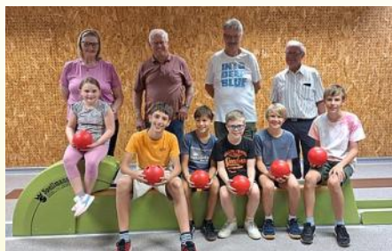
Ferien Aktiv - Kinderkegeln, 24. Juli 2024

Du möchtest mehr Fotos unsere Veranstaltungen sehen? Kein Problem. Auf unserer Homepage findest du jede Menge davon.