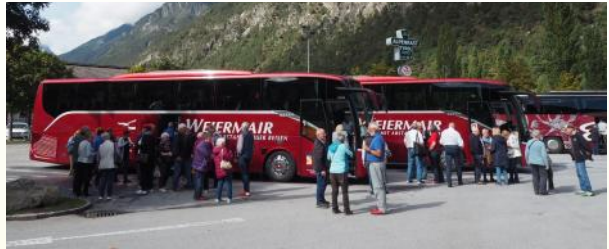
Landeskulturreise Schweiz - Italien - Lichtenstein, 26. bis 29. September 2024