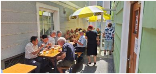
Sparverein-Grillfest, 09. August 2024