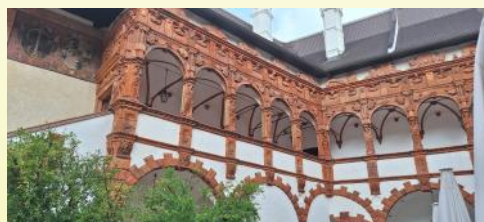
Schallaburg und Stift Melk, 04. Juli 2024