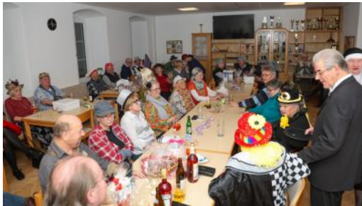
Sparverein-Fasching, 09. Februar 2024

Jahreshaupt-versammlung 05. Februar 2024